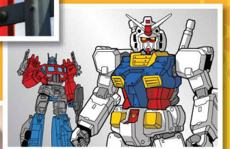
หุ่นยนต์กันดั้ม Gundam model