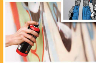
กราฟฟิตี้ Graffiti