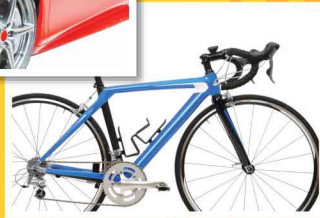
รถจักรยาน Bicycle