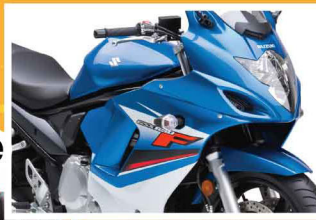
รถจักรยานยนต์ Motorcycle